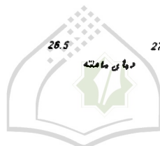
نمودار شماره (۲) رابطه بین نیازهای آبی محصول و عملکرد آن