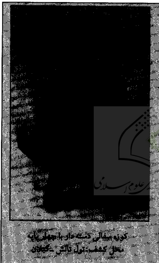
کوبه میانی دشته دار باجهولیان محل کشف تپه تالش - گیلان

موضوعات محوری همایش که در فراخوان اعلام شده بود عبارت بودند از: ارائه گزارش کاوش‌ها، بررسی‌ها و گمانه‌زنی‌هایی که طی سال‌های اخیر در حوزه جغرافیایی شمال و شمال شرق ایران صورت گرفته است؛ بحث‌های تحلیلی درباره پژوهش‌های میدانی و کاوش‌هایی که در این منطقه اجرا شده است؛ مقایسه میان فرهنگ‌های شمال و شمال شرق ایران و مناطق همجوار.