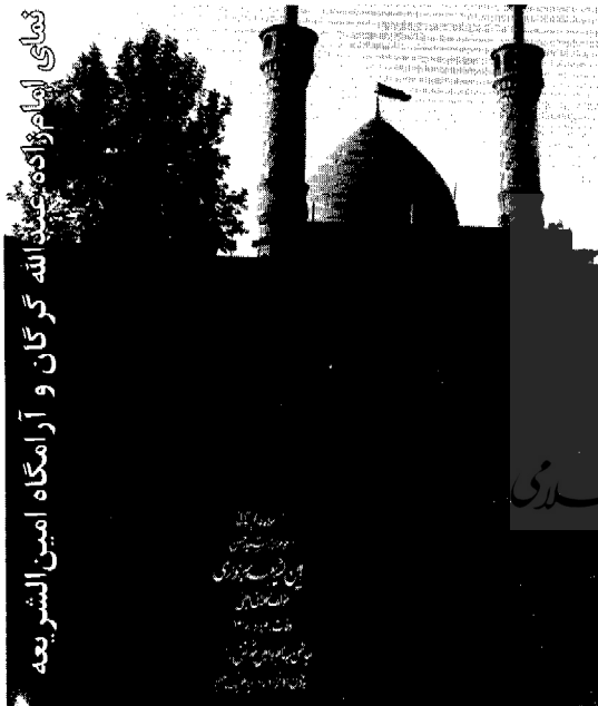
نمایی از آرامگاه امین‌الشریعه