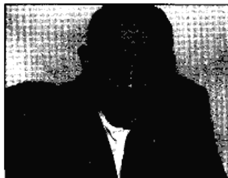
▲ علی عبداللهیان: اعضای اتاق بازرگانی و صنایع و معادن ایران در مقاطع حساس حضور خوبی داشته‌اند.

○ در نشست اخیر هیات نمایندگان اتاق ایران نیز مذاکرات مفیدی پیرامون هدایت کمک‌هایی برای زلزله زدگان قزوین، همدان و زنجان انجام