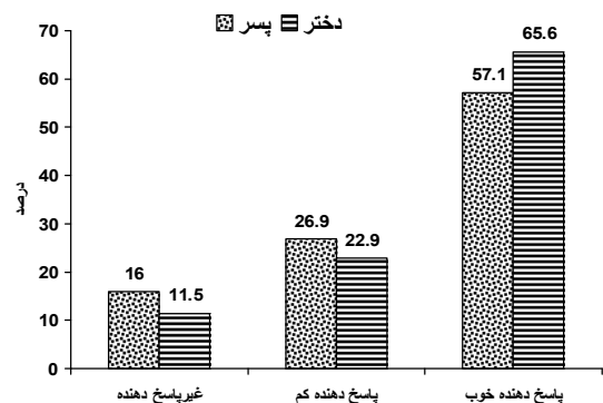
نمودار ۱: میزان پاسخ‌دهی به سه نوبت واکسیناسیون علیه ویروس هیپاتیت B در کودکان ۷ تا ۱۲ ماهه شهر گرگان به تفکیک جنس در سال ۱۳۸۵

در این مطالعه ۲۱۵ کودک ۷ تا ۱۲ ماهه شرکت داشتند که ۱۱۹ نفر (۵۵/۳ درصد) پسر و ۹۶ نفر (۴۴/۷ درصد) دختر بودند. در کل افراد مورد مطالعه ۸۶ درصد بالای ۱۰ واحد بین‌المللی Anti-HBs داشتند و پاسخ به واکسیناسیون را نشان می‌دادند و ۳۰ نفر (۱۴ درصد) نیز زیر ۱۰ واحد بین‌المللی آنتی‌بادی را داشتند که نشان‌دهنده عدم پاسخ به واکسن بود. میانگین تیتراژ آنتی‌بادی علیه واکسن در کودکان مورد مطالعه در پسرها ۱۵۸/۴۸ با انحراف معیار ۱۲/۰۲ و در دخترها ۱۸۷/۵۵ با انحراف معیار ۱۳/۸۳ واحد بین‌المللی به دست آمد. میزان پاسخ‌دهی به سه نوبت واکسیناسیون در بین پسرها ۸۴ درصد و در بین دختران ۸۹/۹ درصد بود (نمودار ۱).