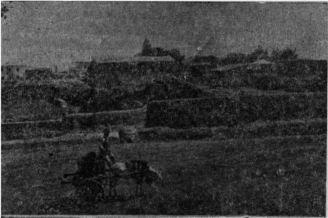
دور نمای قسمتی از کبند قابوس

بعداً و خرابی نهاده تا اینکه امروزه مجدداً رو به عمران و ترقی گذاشته و تاحدی اهمیت تجارتي حاصل کرده است این محل مشابهت بسیاری قراء و قصبات ترکمان ندارد مانند سایر قصبات مملکت است هوای آن نسبتاً خشک و سالم و در تابستان گرم است جمعیت آن نیز مخلوطی است از طوایف مختلف و عده قلیلی ترکمان مزارباشکوه قابوس در سمت شمال قصبه واقع و عبارت از تپه ایست که ۹۷۵ متری میان تهی (تقریباً بشکل استوانه مخروطی) با ارتفاع ۵۲ متر و قطر ۹۷۵ متر بر فراز آن استوار گردیده و چنانچه از تاریخ مصرح آن برمیآید در تاریخ ۳۷۵ شمسی بفرمان امیر شمس المعالی قابوس بن وشمگیر زیادی برپا شده است مدتی بود در حوالی پایه این یادگار استانی رخته و خرابی وارد شده و چیزی نمانده بود که این بنای عظیم را ویران و مارا از وجود چنین اثر شگفت انگیزی محروم سازد خوشبختانه در سال ۱۳۰۷ موقعاً که موکب مبارک اعلی حضرت اقدس شاهنشاه پهلوی