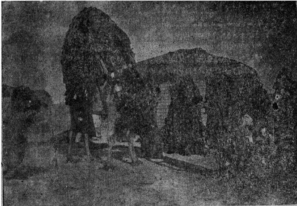
شتر حامل عروس

شب قبل از عروسی پدر داماد پدر دختر خبر میدهد که همراه کجاوه حامل عروس چند گوسفند بفرستم جو ابا يك يا دو گوسفند تعیین میشود اگر گوسفند دو رأس باشد یکی را در منزل دختر میکشد و دیگری را نگاه می دارد .