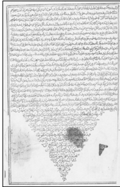
صفحه پایانی نسخه چاپ سنگی مجالس‌المتقین