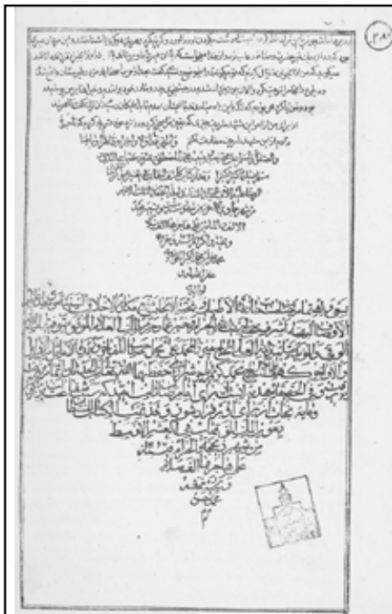
صفحه پایانی نسخه چاپ سنگی کاشف النقباب