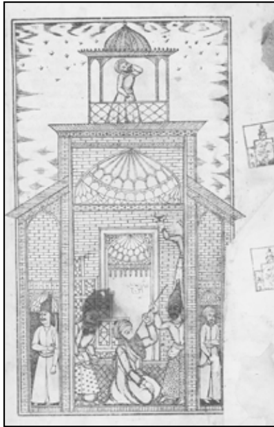
سیاه‌قلم نسخه چاپ سنگی مجالس‌المتقین