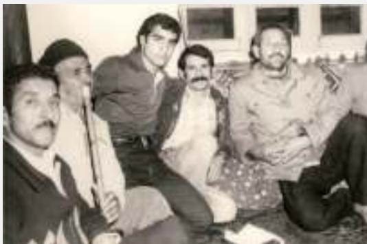
محل هنری کتول، محله‌ی خارکلاته، پائیز سال ۱۳۵۷ خورشیدی

در اجرای «بیدخوانی»، ابتدا نوازنده به عنوان مقدمه و پیش‌درآمد، یکی از آهنگ‌های سازی (بدون کلام) را اجرا می‌نماید که به این عمل در موسیقی کتول؛ «مقام دانی» گویند. سپس با یک «سروانگ» [sar vāng]، خواننده آماده اجرای آواز می‌شود.