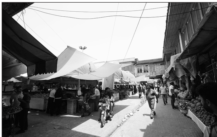
عکس ۱- راسته شرقی-غربی بازار نعلبندان؛ عکاس: معین مطلق: ۱۳۹۰

در میانه‌ی بدنه‌ی جبهه‌ی جنوبی (در این قسمت) معبری شمالی-جنوبی به سمت خیابان امام‌خمینی وجود دارد که راسته‌ی بزازها (راسته‌ی قمی‌ها) را تشکیل داده است. در جبهه غربی این راسته یکی از ورودی‌های حمام قاضی و مغازه‌های موقوفه آن قرار دارد و در جبهه شرقی پاساژ رضوی و تعدادی مغازه که همگی پارچه‌فروشی و بزازی هستند قرار دارد. پاساژ رضوی در گذشته خانه‌ی تاریخی خانواده‌ی سادات رضوی استرآباد بوده است که بخشی از آن سال‌ها پس از احداث خیابان پهلوی، تخریب و تبدیل به پاساژ شده است. قدمت سایر مغازه‌ها، در این راسته، به دوره‌ی پهلوی برمی‌گردد.