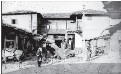
عکس ۵- درخت کهنسال قطع شده نعلبندان در طرف غرب و صافی غربی مرکز اسناد دانشگاه شهید بهشتی: دهه ۱۳۵۰خ