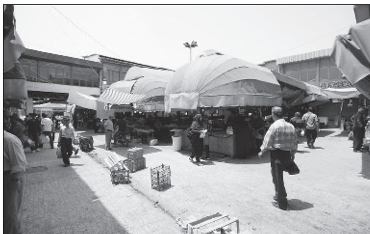
عکس ۲- تکیه و صافی شرقی نعلبندان؛ عکاس: معین مطلق: ۱۳۹۰