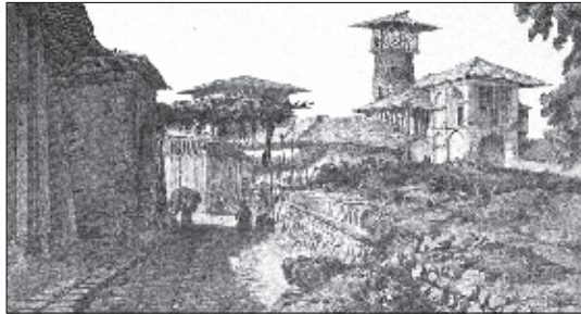
عکس ۳- سردر مسجد جامع استرآباد، گورستان مقابل آن و یکی از گذرهای شهر در طرف غربی مسجد در دوره قاجار؛ سازمان جغرافیایی نیروهای مسلح، ۱۳۷۴، ص ۱۱

آمده، این بازار هم‌چنان یکی از محورهای ارتباطی بسیار مهم در بافت قدیم گرگان محسوب شده و به لحاظ ارتباطات اقتصادی، اجتماعی، مذهبی و تبادل اخبار و اطلاعات از جایگاه ویژه‌ای برخوردار است.