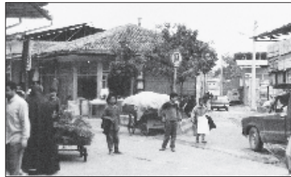
عکس ۴- واشدگاه غربی بازار نعلبندان پس از تکیه نعلبندان