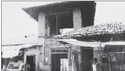
عکس ۷- سردر مسجد جامع در بازار نعلبندان ۱۳۵۷خ