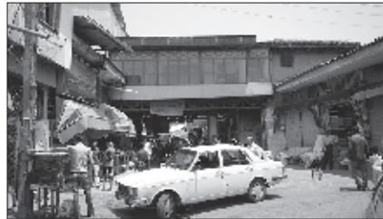
عکس ۶- بازار نعلبندان در طرف غرب و صافی غربی، در وضعیت کنونی عکاس: معین مطلق. ۱۳۹۰