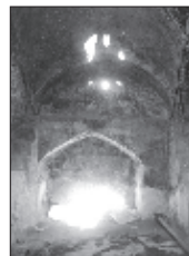
عکس ۸- چال حوض حمام قاضی ۱۳۸۶