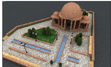
طرح ۱- طرح اولیه احیاء مقبره‌العلماء سیدباقر