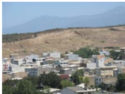
تصویر ۴ برداشت خاک رس جهت شهرسازی دره نهار خوران - گران