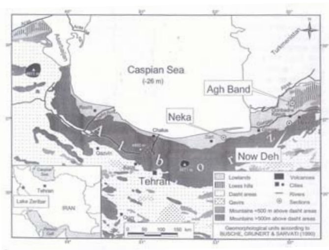
شکل شماره ۱: موقعیت منطقه مورد مطالعه (مارتین کهل، ۲۰۰۵)