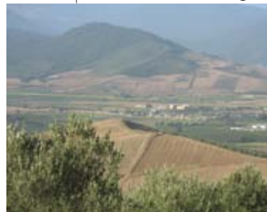
تصویر ۲ تغییر کاربری جنگل به کشاورزی