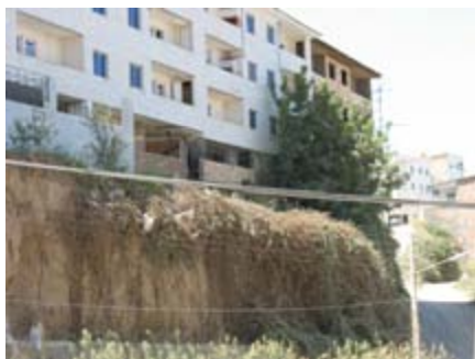
تصویر ۵ خانه سازی روی تپه های لسی در شهرک صدا و سیما

شکل‌گیری شهرگران در گذشته بر روی اراضی لسی نکته قابل توجه و مهمی محسوب می‌گردد. ولی گسترش شهر چه به واسطه سکونت (در منطقه صدا و سیما) و چه به عنوان سایر فعالیت‌های انسانی و اقتصادی از جمله: ویلاسازی و سایر پروژه‌های توریستی (دره نهارخوران) بر روی اراضی و مناطق تپه ماهوری لس می‌تواند زنگ خطری جدی برای مدیران و برنامه‌ریزان شهری محسوب گردد، زیرا همانگونه که بیان شد، لس سازندی سست و حساس بوده و پتانسیل بسیار بالایی در فرسایش پذیری و حرکات دامنه‌ای همچون لغزش دارد، همچنین سازند یا سنگ بستر زیرین آهکی آن نیز توان اینگونه حرکات را بعد از نفوذپذیری در هنگام بارندگی‌های منطقه رخ می‌دهد، افزایش داده لذا احداث هرگونه ساخت و ساز و همچنین سایر فعالیت‌های عمرانی در منطقه گران می‌بایست از قبل و با انجام مطالعات دقیق علمی صورت پذیرد. در این راه مدیران و برنامه‌ریزان منطقه‌ای، ناحیه‌ای و محلی با اتکا بر دانش محیطی و مدیریت محیط که در ژئومورفولوژی به آن پرداخته می‌شود می‌توانند نتایج مثبت و مفیدی را اخذ نموده و به کار گیرند و موفقیت‌های چشمگیری را حاصل نمایند.