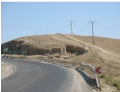
تصویر ۳ جاده سازی در اراضی لسی و تخریب در جهت حاصل از آن

بعد از توضیحاتی که در ارتباط با عوامل اصلی طبیعی زمین شناسی و اقلیم بیان شد، سایر عوامل غیر طبیعی که به عنوان عوامل اصل تهدید برنامه ریزی محسوب می گردد، نیز مورد بررسی قرار خواهیم داد. در بحث عوامل غیر طبیعی یا انسانی نیز عوامل متعددی دخیل هستند که از جمله مهم‌ترین این عوامل که عمدتاً به واسطه انجام فعالیت‌های غیر علمی صورت می پذیرد و می توانند منجر به شکل‌گیری اشکال مورفولوژیک گردیده و آسیب‌ها و عوارض محیطی جبران ناپذیری را همچون لغزش‌ها، خندق‌ها و... به همراه داشته باشند می‌توان از قطع درختان جنگل، تغییر نوع درختان جنگل جهت کاشت درختان میوه و احداث باغات، ورود دام به جنگل جهت چرا در بخش مناطق مرتفع و جنگلی و همچنین برداشت بی رویه و غیر علمی از خاک لس جهت صنایع آجر سازی و احداث جاده در اراضی لسی در نواحی شمالی تر منطقه مورد مطالعه نام برد.