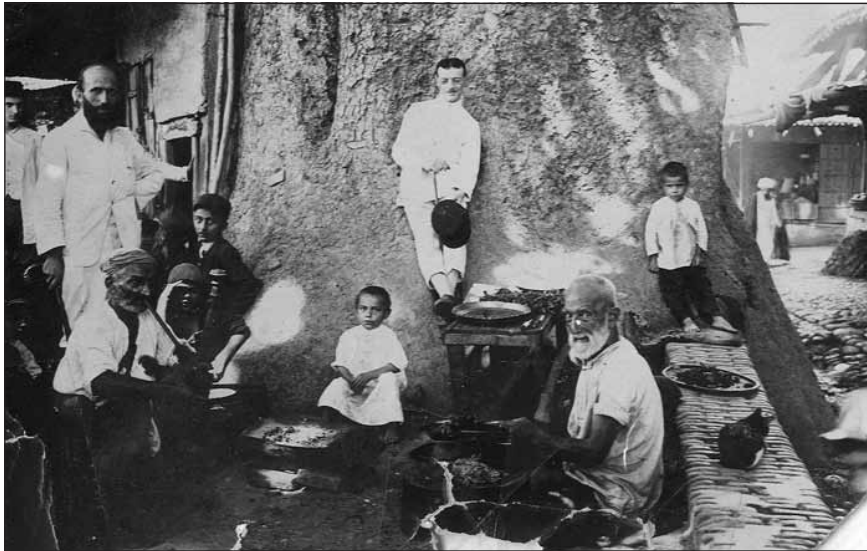
درخت چنار کهنسال محله سرچشمه استرآباد، معروف به چنار پیر و دکان واقع در شکاف آن. تاریخ عکس: دهه ۱۳۱۰ خورشیدی.

وجود مراکز اسناد محلی در این است که در این مراکز اسناد تمرکز بیشتری بر روی اسناد محلی صورت می‌گیرد و در نتیجه بسیاری از اسناد محلی که از دسترس مراکز اسناد ملی دور مانده‌اند، شناسایی و جمع‌آوری می‌شوند. همچنین کارشناسان محلی شناخت بیشتری از مجموعه اسناد خصوصی و خانوادگی داشته و خانواده‌ها نیز به کارشناسان بومی اعتماد بیشتری دارند. علاوه بر این در فهرست‌نویسی اسناد، مسائل و موضوعات محلی پررنگ‌تر دیده شده و به همین نسبت دسترسی پژوهشگران محلی به اسناد آسان‌تر خواهد بود. از همه مهم‌تر این‌که صاحبان مجموعه‌های اسناد شخصی و خانوادگی در تماس و تعامل با مراکز اسناد محلی به اهمیت و ارزش اسناد خود پی برده و در نگهداری و حفاظت اسناد خود آگاهی بیشتری کسب کرده و در نتیجه تلاش بیشتری خواهند کرد.