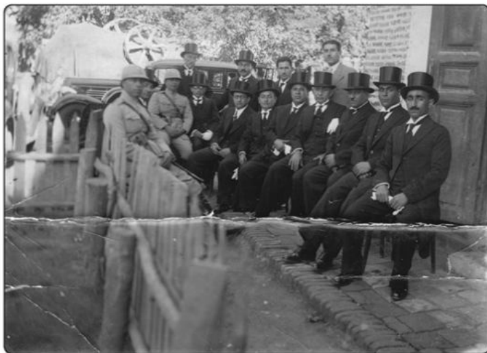
هیأت تشریفات استقبال از رضاشاه در بندرگز (حدود ۱۳۱۰ ش)

۱۲. پاسخ به نامه درخواست انتقال نفت مورخ ۱۸ مرداد ۱۳۱۲ (مطابق ۱۷ ربیع ۱۳۵۲)، طبق این نامه؛ حکومت استرآباد به واسطه‌ی حکومت بندرگز، در جواب درخواست دو نفر از تجار بندرگز (کرامتی و رضائی) می‌نویسد اگر آقایان تجار تعهد می‌دهند که مقدار نفت موجود موجبات فراوانی نفت در محدوده گرگان و تویب را فراهم می‌کند، مانعی برای انتقال مازاد آن به نقاط دیگر وجود ندارد.