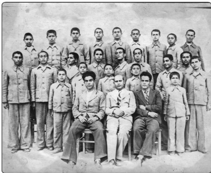
مدرسه پسرانه شاهپور بندرگز (حدود ۱۳۲۲ش)