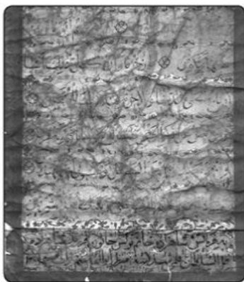
بخش‌هایی از طومار نرگس خاتون مورخ ۱۲۸۹ق