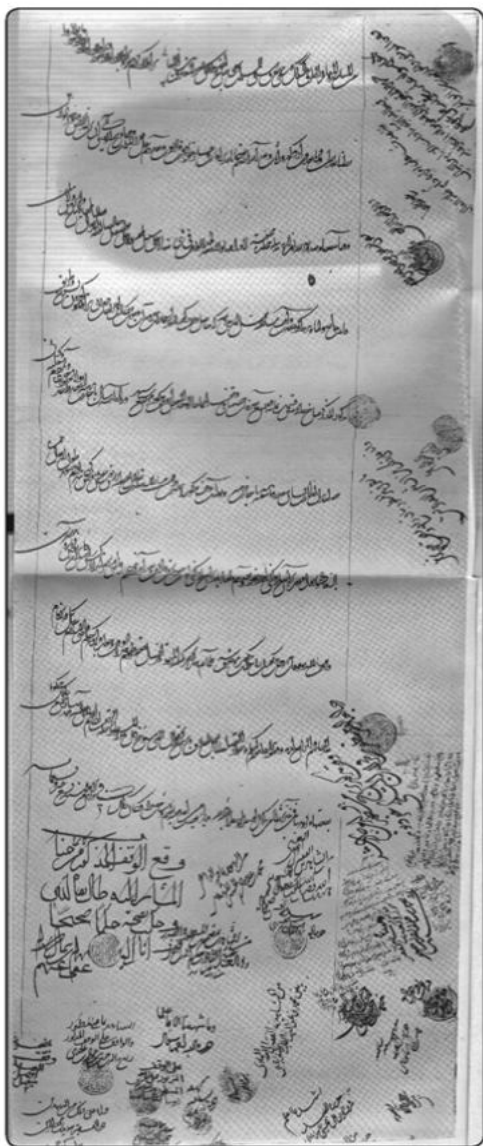
قسمتی از آخر وقتنامه حواجه مظفرین فخرالدین احمد پنجگی مورخ ۹۱۹ق